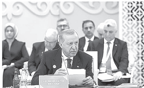
Cumhurbaşkanı Erdoğan, Ortak Türk alfabetinin eğitimden kültüre, akademiye iş birliğinden dijital dönüşüme kadar geniş bir alanda kullanılmasının önemli olduğunu belirterek, “Ortak dilimizin zenginliğini dijital dünyada görürür kılacak Türk dili modeli ve benzeri yapay zekâ temelli girişimlerin desteklenmesi gerektiğine inanıyoruz” dedi.

Türk Dünyası Sivil Toplum Destek Sistemi tarzı modellerle bir alanda dijital iş birliğini güçlendirilebileceğini belirten Cumhurbaşkanı Erdoğan, şunları kaydetti: “Yakın çevremizde yaşanan krizler, Türk dünyasının dayanışma içinde hareket etmesinin stratejik değerini bir kez daha ortaya koymuştur. Jeopolitik sinamalar karşısında istişare mekanizmalarımızı ve eş güdümlümüzü güçlendirmeliyiz. TDT Plus formatının bir önce