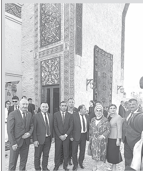
В Туркестане состоялся саммит Организации тюркских государств

Знаменательное и незабываемое событие для всего тюркского мира и братских среднеазиатских стран! В республику Казахстан с дружеским визитом, для участия в саммите Организации тюркских государств, прибыл Президент Турции Реджеп Тайип Эрдоган вместе с официальными лицами государства и первой леди, госпожой Эмине Эрдоган. В аэропорту Астаны в торжественной обстановке Президента Турции встречал Президент РК Касым-Жомарт Токаев.