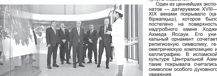
Президент Казахстана Касым-Жомарт Токаев, Президент Азербайджана Ильхам Алиев, Президент Кыргызстана Садыр Жапаров, Президент Турции Реджеп Тайип Эрдоган и Президент Узбекистана Шавкат Мирзиёев ознакомились с духовными реликвиями мавзолей Ходжи Ахмеда Яссауи.

Главам государств была представлена выставка редких артефактов XIV—XV веков, связанных с жизнью выдающегося мыслителя и историей мавзолей. В числе ценных экспонатов вошла уникальная деревянная дверь усыпальницы, сохранившаяся с XIV века. Дверь украшена костью, пластинами и позолоченными надписями, а также орнаментирована арабскими текстами в стихах куфи и сульс.