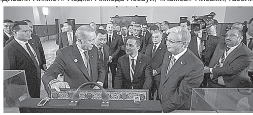
Президент Турции Реджеп Тайип Эрдоган передал мавзолее рукописный Коран, созданный османским каллиграфом Ахмедом Шемседдином Карахисари.