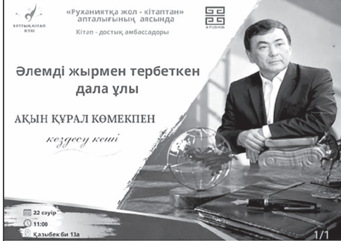
Әлемді жырмен тербеткен дала ұлы