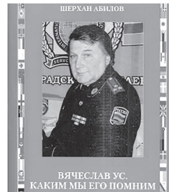
ВЯЧЕСЛАВ УС. КАКИМ МЫ ЕГО ПОМНИМ

Вы держите в руках мою двадцать шестую книгу: «Вячеслав Ус. Каким мы его помним». Книга посвящается 80-летию юбилею руково-