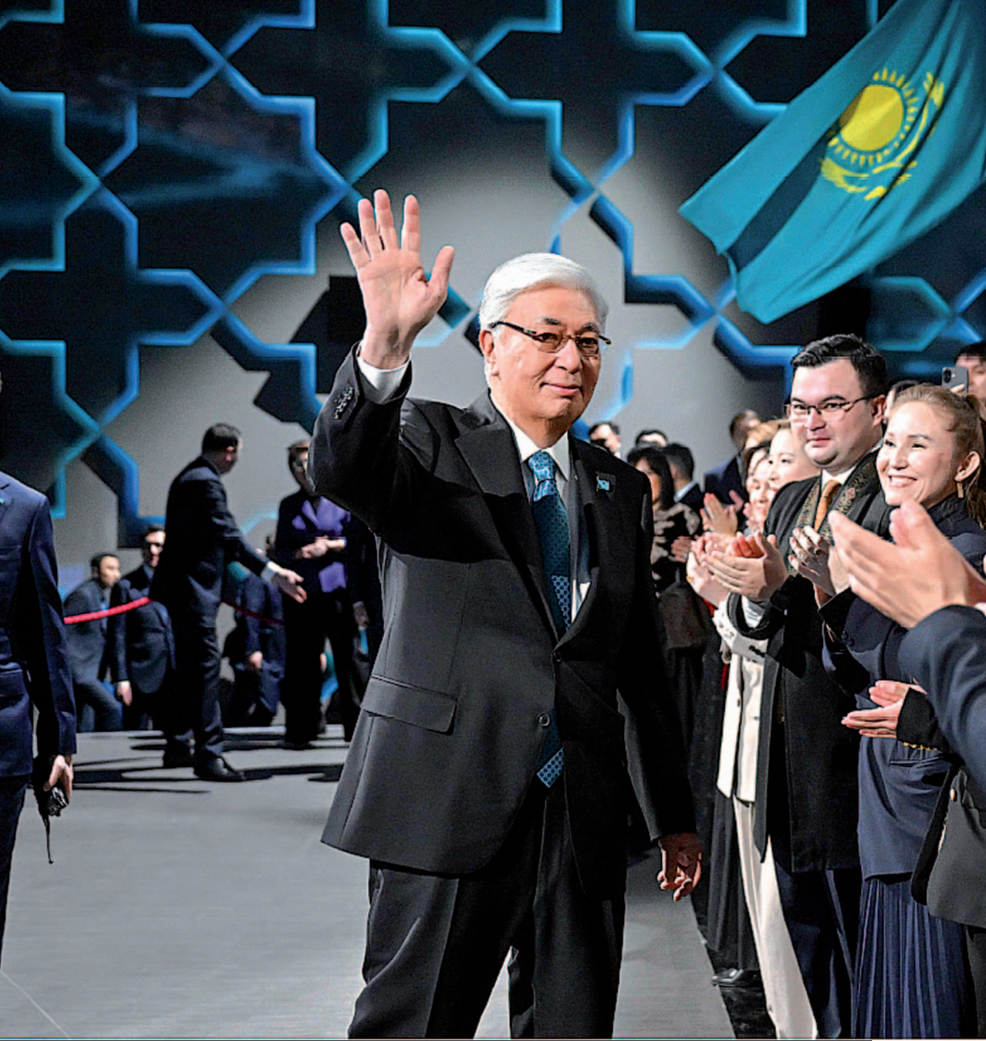
Cumhurbaşkanı Kasım-Jomart Tokayev, Cumhuriyet Referandumu Sırasında Yapılan Çıkış Anketinin Sonuçlarıyla Tanıştı