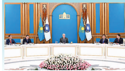
Поздравление Главы государства Касым-Жомарта Токаева с Днем единства народа Казахстана