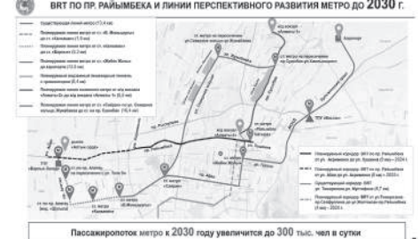
Пассажиропоток метро к 2030 году увеличится до 300 тыс. чел в сутки