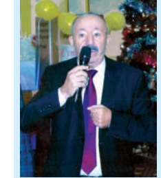
Новогодний праздник в Тобелийском районе