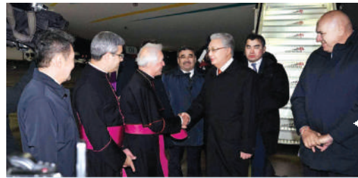
К. Ж. Токаев прибыл с официальным визитом в Италию

"Türkiye Yüzyılı'nı, bizden sonraki nesillere bırakacağımız en büyük miras olarak görüyoruz"