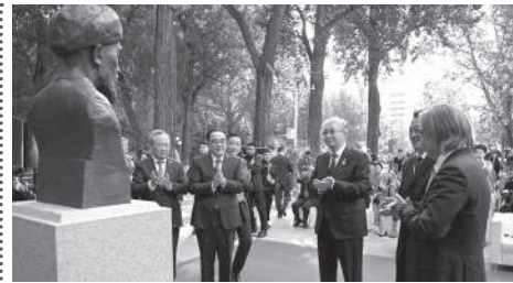
Глава государства принял участие в церемонии открытия бюста Аль-Фараби в Пекине

Президент Касым-Жомарт Токаев принял участие в торжественной церемонии открытия бюста средневекового философа и ученого Абу Насра Аль-Фараби на территории Пекинского университета языка и культуры.