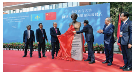
Глава государства принял участие в церемонии открытия бюста Аль-Фараби в Пекине