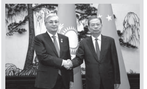
Глава государства провел встречу с Председателем Постоянного комитета Всекитайского собрания народных представителей Чжао Лэцзи

На форуме также выступили Председатель Китая Си Цзиньпин, Президент России Владимир Путин, Президент Индонезии Джоко Видодо, Президент Аргентины Альберто Фернандес, Премьер-министр Эфиопии Ахмед Абий, Генеральный секретарь ООН Антониу Гутерриш. В мероприятиях форума участвуют более 20 глав государств и представители свыше 130 стран и международных организаций.