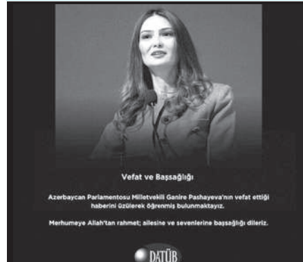
Vefat ve Başsağlığı

Azerbaycan Parlamentosu Milletvekili Ganire Paşayeva'nın vefat ettiği haberini üzülerek öğrenmiş bulunmaktayız.