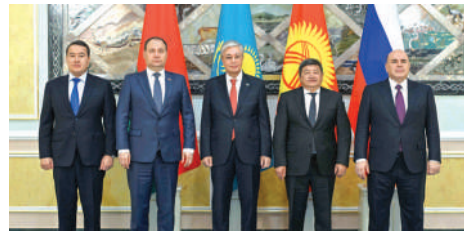
Президент Касым-Жомарт Токаев встретился с главами правительств России, Беларуси и Кыргызстана