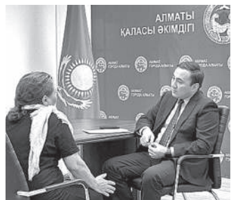
Алматы қаласы өкімдігі