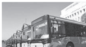
Алматы қаласының бюджетін нақтылау мәлішерлемесі бойынша қоғамдық көліктер тарифы өзгерді

Алматы қаласында, қала мәслихатының кезектен тыс VII сессиясы өтті. Сессияда «коммуналдық қызметтер тарифінің өсуіне байланысты халықтың әлеуметтік осал топтарының жекелеген санаттарына әлеуметтік көмек көрсету және өтемақы төлеу мөлшерін белгілеу қағидалары» қарады.