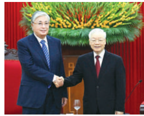
Глава государства встретился с Генеральным секретарем Центрального комитета Коммунистической партии Вьетнама Нгуен Фу Чонгом