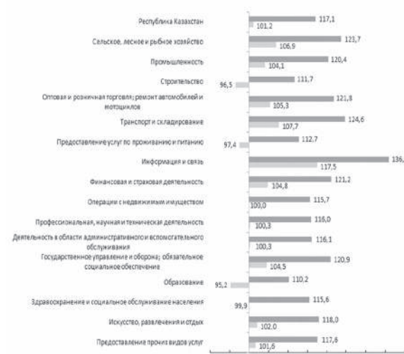
Индекс номинальной заработной платы, в процентах к соответствующему кварталу 2022 года

В реальном выражении к соответствующему кварталу прошлого года зарплата снизилась в отраслях строительства — на 3,5%, предоставления услуг по проживанию и питанию — на 2,6%, образования — на 4,8%, а также здравоохранения и социального обслуживания — на 0,1%.