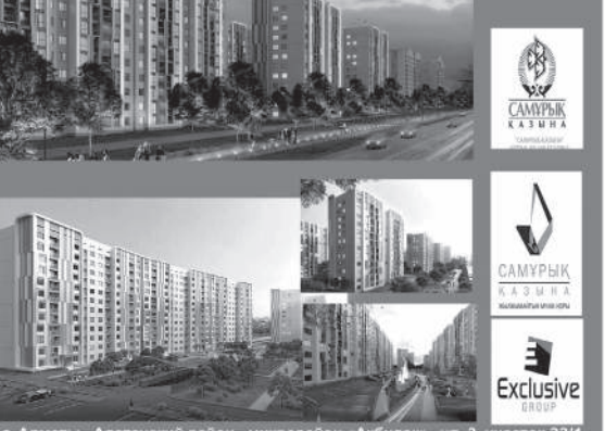
г. Алматы, Алатауский район, микрорайон «Ақбулак», ул. 3, участок 33/1.