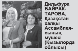
Дильфура БАЙРАК-ТАРОВА, Қазақстан Ассамблеясының мүшесі (Қызылорда облысы)

Мен өзім Қармақшы ауданы №108 мектеп директорының орынбасары болып жұмыс істеймін, география пәнінің мұалімімін. Көшеден бері Ассамблея сессиясының жұмысына қатысып жатырмыз. Көптеген мәселелер көтеріліп, ұсыныстар айтылып жатыр. Елімізде тұрып жатқан халықтардың мақсаты бір, ол — Қазақстан халқының бірлігін, достығын нығайту, осы үрдісті жалғастыру. Оған өзім де мұалім ретінде үлесімді қоса беремін.