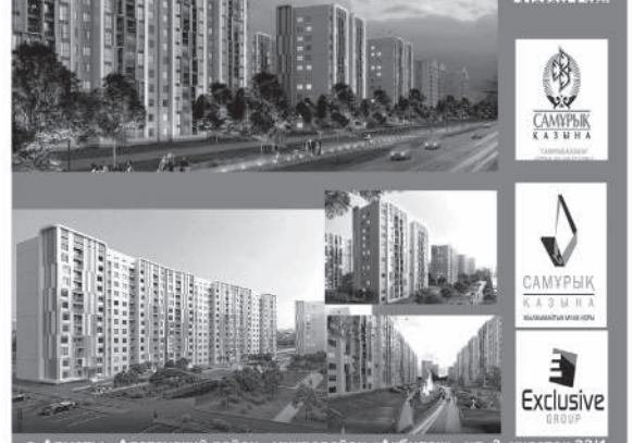
г. Алматы, Алатзуский район, микрорайон «Ақбулак», ул. 3, участок 33/1.