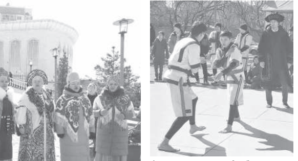
Ашық аспан астында барлық ұлт өкілдері бірлесіп, Ұлыстың Ұлы күні — Наурыз мейрамын тойлап жатырмыз. Біздің жастарымыз қазан-қазан палуу дайындап, ұлттық тағамдарымызды келген көпшілікке ұсынып жатыр. Кіз үйдің ішінде ұлттымыздың мәдениетін