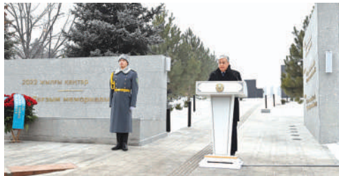
Президент принял участие в открытии мемориала «Тағзым» Стр. 2