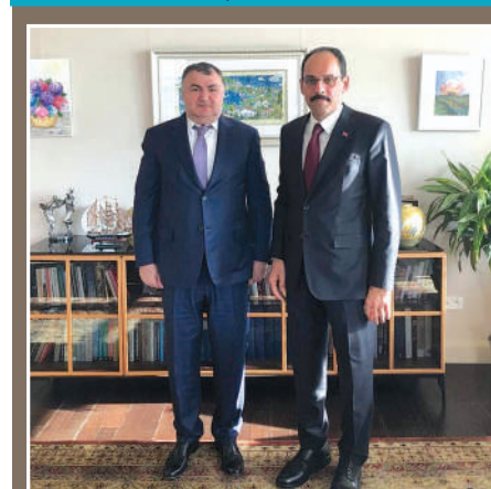
DATÜB Genel Başkanı Ziyatdin Kassanov, Cumhurbaşkanlığı Sözcüsü Ibrahim Kalin ile görüşti

Cumhurbaşkanlığı Sözcüsü ve Büyükelçi İbrahim Kalın, birtakım temaslarda bulunmak üzere Ankara’da bulunan Dünya Ahıska Türkler Birliđi (DATÜB) Genel Başkanı Ziyatdin Kassanov ile Cumhurbaşkanlığı Külliyesi’nde bir araya geldi.