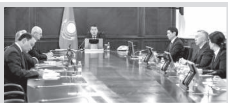
Основную задачу Правительства на ближайшие 7 лет обозначил Смаилов

Премьер-министр Казахстана Алихан Смаилов обозначил ключевые направления работы Правительства на ближайшие годы в свете прошедших выборов президента страны.