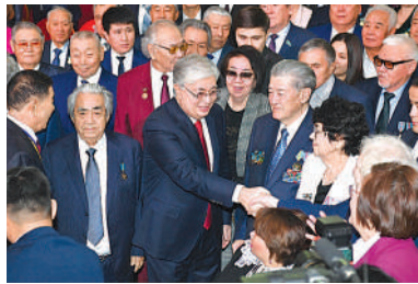
Глава государства провел встречу с общественностью Атырауской области