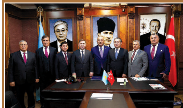
Dışişleri Bakanı Mevlüt Çavuşoğlu, Kazakistan'da Çimkent Fahri Başkonsolosluğu'nun açılış törenine katıldı