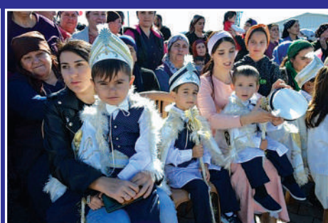
DATÜB, her zaman Ahiskalı Türk kardeşlerimizin yanındadır!