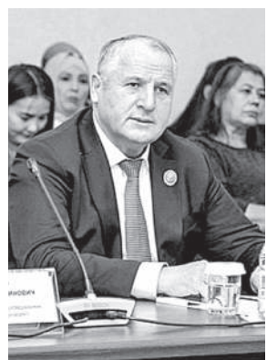
Поворотный пункт в истории

Двадцать пятого октября 1990 года Верховный Совет Казахской ССР принял Декларацию о государственном суверенитете. основополагающие принципы и идеи, определенные в этом историческом документе, и сегодня не утратили своей актуальности.