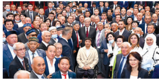
Президент Казахстана в южном регионе