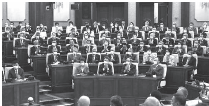
Потому необходимо разработать Комплексный план по борьбе с наркоманией и наркобизнесом.

Новая президентская система укрепит политическую стабильность, устойчивость казахстанской модели общественного устройства.