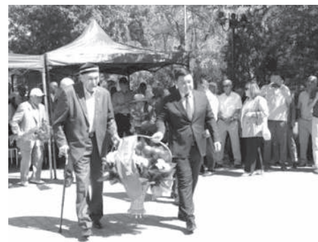
В г. Кентау Туркестанской области отметили юбилей Ачполиметаллического комбината.

Немного хроник: 24 августа 1927 года постановлением Президиума ВСНХ СССР № 26/465 был создан Ачсайский полиметаллический комбинат на базе Ачсайского свинцово-цинкового месторождения. Месторождение известно с XVII века, а разработка началась в 60-е годы XIX века.