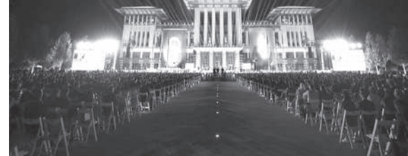
Сумhurбақшани Ердоған, 26 Ағустос’ta Malazgirt’te, Alparslan’ın Anadolu kapılarını açtığı topkaraklarda otaklarda olduklarını belirterek, “Oradan, Fatih ve cumhuriyetimizin banisi Gazi Mustafa Kemal ile büyüyen bir Türkiye, Türkiye, kendine yakışanı yaptı, yapıyor ve yapacaktır, bunu herkes bilsin Yunanistan’ın adalara üler tesis etmesi, kurması Türkiye için hiçbir zaman anlam teşkil etmez. Burada düşüncesiz gereken Yunanistan’a bunca desteği verenler, kendileri bundan sonra ne yaparlar, onu bilemem” diye konuştu.

Сумhurбақшани Ердоған, NATO’nun en büyük gücü ABD’nin, Türkiye’nin tamamen kendi güvenliğini ihtiyaçları için olduğunu defaatle ifade ettiği S-400 sistemleri alması, güya kendi uçaklarına tehdit olarak görülmesini belirterek, sunları aktardı: “Bu adımıмız peşinatını ödediğimiz F-35 uçaklarının verilmesinden her alanda savunma sanayi ürünlerine ve hatta daha ötesine geçen ambargolara maruz bırakılmaya varan fiili eylemlerle karşılamaştık. Şimdi aynı Amerika’nın Yunanistan’ın bir NATO hava gücüne karşı S-300 sistemlerini harekete geçirmesine nasıl cevap vereceğini meraklı bekliyoruz. Üstelik Amerika, bize vermediği F-35’leri Yunanistan’a ikram edecek Rus hava savunma sistemlerinin güya gözü gibi sakındığı bu uçaklarla