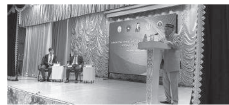
Работа форума была организована в рамках трех секций: