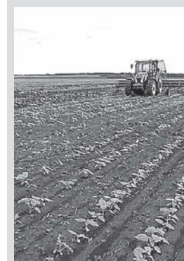
Дайындаған Айна ТӨЛЕУТАЕВА

Алматы облысы өкімі баспасөз қызметінің мәліметінше, көктемгі егіс жұмыстарына минералды тұқымдылардың қажеттілігі 23 мың тонна болса, соның 13,7 мың тоннасын немесе 59,6%-ін 998 шаруашылық субъектілері алып үлгерген. Жаппы өңірде көктемгі егіс жұмыстары мамыр айына дейін жалғасады.