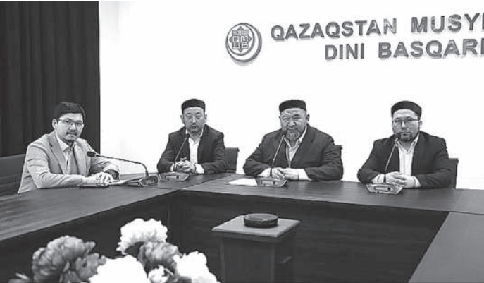
QAZAQSTAN MUSYL DINI BASQARIM

Біз талай сындарлы сәттерді бастап көшіп келе жатқан халықтық. Иманымыз бен бірлігіміздің арқасында қиындықты өңсеріп, өсіп-өнген өліміз. Аллаға шүкір, өлдімізді көрсетіп, кешегі «қасіретті қаңтар» оқиғасын өңсердік. Екі жылға созылған пандемиялық жағдай кезінде де бірлігімізді көрсеттік», — деді Қазақстан мұсылмандары діни басқар-