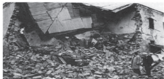
Сәрсенбайжанның басып алынған аумақтарындағы жағдай