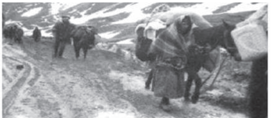
Әзербайжандық босқындар Армениядан, тұтқиыл жерлерінен күштеп қуылды