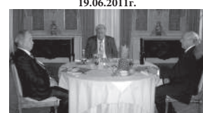
Небесный верблюд - 02.07.2014г.