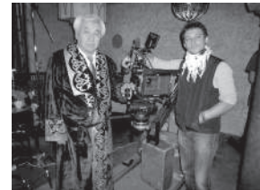
Дорогой мой человек