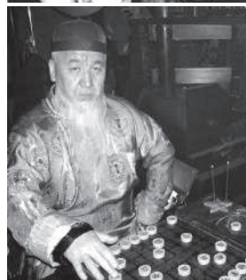
28 - 23.01.2008г. - Золото Трон