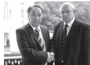
Ельцин. Три дня в августе - 19.06.2011г.