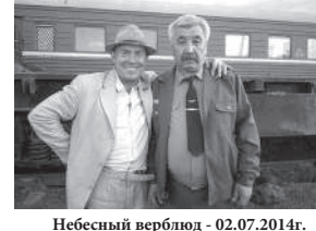
Дорогой мой человек