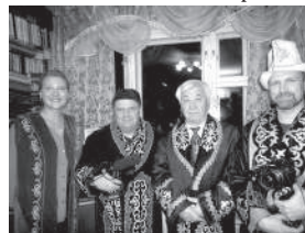
Документальный фильм о национальных костюмах