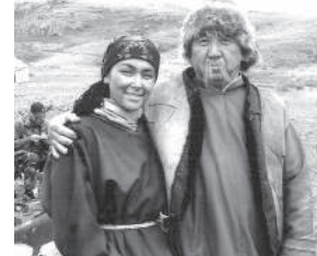
Дорогой мой человек