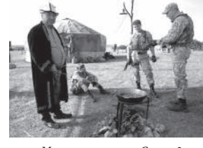
Морские дьяволы - Смерч-3 - 18.05.2015г.