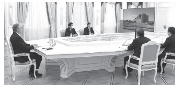
Открывая заседание, Касым-Жомарт Токаев выразил благодарность Главам государств за принятое предложение Казахстана об участии в неформальном саммите Совета сотрудничества тюркоязычных государств.

— Мы планировали организовать эту встречу в священном для всех нас Туркестане. Однако из-за сложной ситуации с пандемией было принято решение провести саммит в онлайн-формате. Я надеюсь, что после завершения эпидемии мы сможем встретиться лицом к лицу. Пользуясь случаем, еще раз поздравляю всех вас с Наурызом. Это особый праздник всех тюркских народов. Желаю процветания братским странам, — сказал Президент Казахстана.