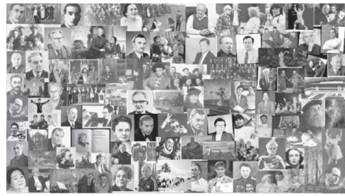
Полосу подготовила Аида МАРАТ

Документальные данные извлечены из архивов, интервью, медиа-ресурсов и сформированы в энциклопедии в соответствии с основным принципом казахстанской этнополитики — «единство в многообразии», и в контексте государственных задач по модернизации общественного сознания.