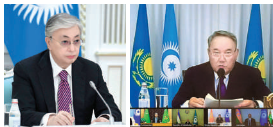
Глава государства принял участие на неформальном саммите Совета сотрудничества тюркоязычных государств в онлайн-формате