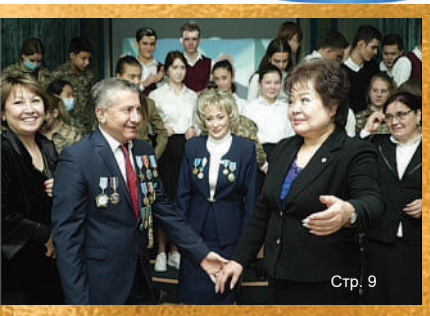
Встречи с интересными людьми

УВАЖАЕМЫЕ ЧИТАТЕЛИ ГАЗЕТЫ «АХЫСКА»! Дорогие друзья, искренне верим, что вы, как и прежде, будете с нами. Подписаться на газету вы можете в любом отделении АО «Казпочта». Город Район/село 12 ай/мес. 4 094,40 4 300,80