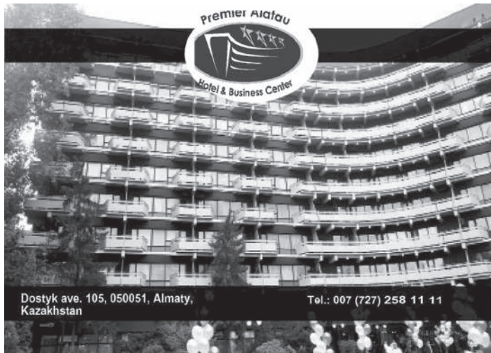
Dostyk ave. 105, 050051, Almaty, Kazakhstan Tel.: 007 (727) 258 11 11