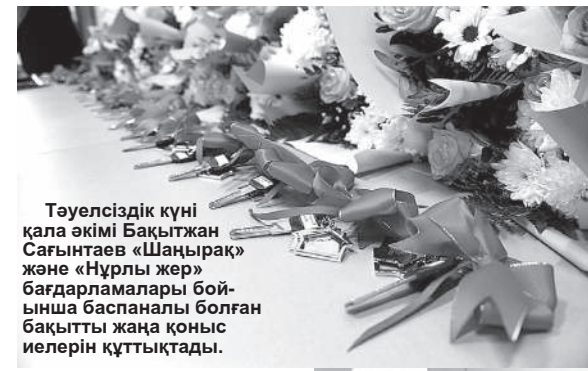
Тәуелсіздік күні қала әкімі Бақытжан Сағынтаев «Шаңырақ» және «Нұрлы жер» бағдарламалары бойынша баспаналы болған бақытты жаңа қоныс иелерін құттықтады.

В итоге, по заверениям селекционеров, данный картофель благодаря своему витаминному составу замедляет старение и даже может быть эффективен при лечении некоторых онкозаболеваний. В «Емдәмдік картоп» или «нижкокалорийный картофель», содержится в 2 раза больше белка, чем в обычных сортах, а потому он является даже диетическим. Ученые уверены, что новый сорт картофеля станет настоящим казахстанским брендом и уже в скором времени появится на всех прилавках не только нашей родины, но и СНГ.