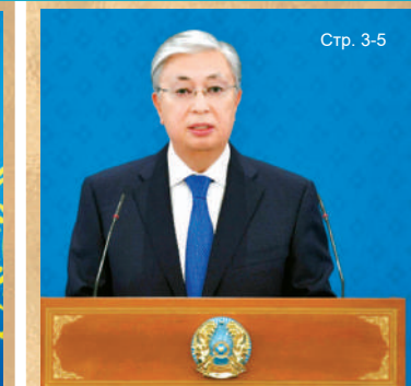
Выступление Президента Касым-Жомарта Токаева на церемонии вручения государственных наград в преддверии Дня Независимости