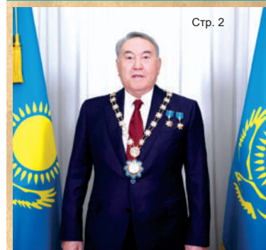
Қазақстан Республикасының Тұңғыш Президенті — Елбасы Нұрсұлтан Назарбаевтың Тәуелсіздік күнімен құттықтауы