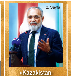
«Kazakistan kendisine ömür biçenleri sukutuhayale uğratmıştır»