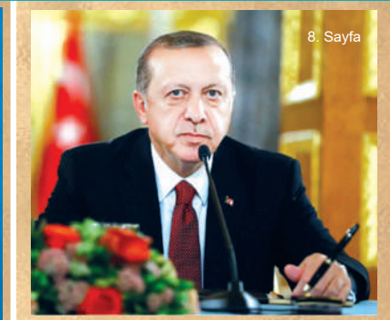
“İçinden geçtiğimiz tarihi dönemde en büyük gücümüz birlik, beraberlik ve kardeşliğimizdir”