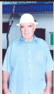
Выражаем искренние соболезнования семье, родным и близким

в жизни ветеранов, мне поручали огромное количество дел. И всегда я был в движении. В 2009 году мою кандидатуру выдвинули от нашего района на вручение ордена «Курмет». И я поехал в Астану. Нурсултан Абиевич пожал мне руку и пристегнул орден. Вся война запомнилась, иногда в памяти всплывают отдельные бои, однополчане, которых мы оставляли там же, на полях сражений. Каждый раз я снова и снова вспоминаю как страшный сон свое второе ранение — это то самое, тяжелое, с которым я до сих пор живу. Это было в сентябре 1943-го. Перед тем, как идти в наступление, командир послал двух бойцов в разведку. Прождав долгое время, мы поняли, что они уже не вернуться. Я тогда