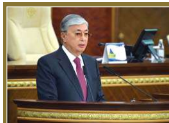
Послание Главы государства Касым-Жомарта Токаева народу Казахстана