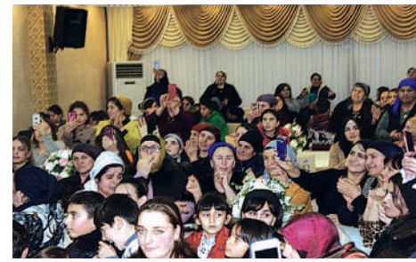
«Ер есімі —ел есінде!» - ескерткіштеріне тағзым жасалды.

daha anladık. Sizlerin ilçemize gelmesine sebep olan değerli büyüklerimize тешеккүр ediyoruz.” dedi.