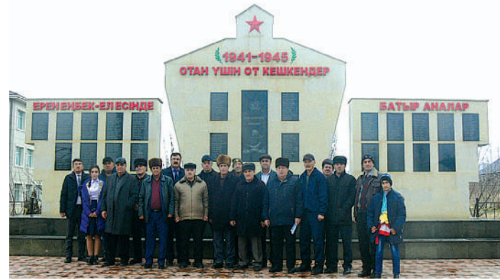
«Ер есімі —ел есінде!» - ескерткіштеріне тағзым жасалды.