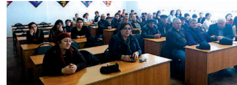
Т. Рысқұлов ауылының тұрғындары бас қосуда белсенділік танытты.

Түлкібас ауданы түрік ұлттық мәдени орталығының ұйымдастыруымен аудан тұрғындарымен кездесулер өтті. Басқосуға оқушылар мен ауыл жастарының бос уақыттарында салауатты өмір салтымен шұғылданыуына, ауыл тұрғындарының қоғамдағы іс —шараларға белсене араласуына күнделікті ақпарат құралдарына оның ішінде «Ахиска» газетіне жазылуына көңіл аударылды. Ел бірлігін