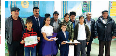
Түлкібас аудандық түрік этномәдени орталығының мүшелері елдің келешегі - дарынды оқушылармен бірге

Түркістан облысы, Түлкібас ауданында дарынды балалардың аймақтық, аудандық фестивалі өтті. Фестивальдің мақсаты - дарынды балаларды анықтау және олардың жұмыстарына қолдау көрсету болды. Фестивальдің бағдарламасына аудандағы өмір сүріп жатқан халықтардың салт-дәстүрлеріне және Тәуелсіздікке арналған тақырыптарда патриоттық өлең оқу, ән айту, би билеу, тоқыма тоқу және сурет салу байқаулары енгізілді.