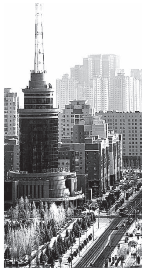
Астана — уникальный по своему значению проект не только с точки зрения экономики, но и модернизации социума. Достаточно вспомнить о настроениях, которые витали в первой половине 90-х годов, когда некоторые граждане, чтобы прокормить свои семьи, уходили из профессии и продавали на базарах товары. Люди тогда элементарно выживали. Для сравнения: общее падение экономики некогда союзных республик в те годы превысило 50%, тогда как Великая депрессия в США, о которой до сих пор с содроганием вспоминают на Западе, нанесла урон, по разным данным, в пределах 29—31%.