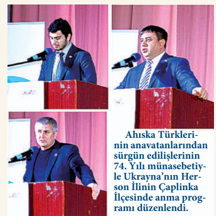
Аһиска Түркерlerinin anavatanlarından сүргүн edilişlerinin 74. Yılı münasebetiyle Ukrayna'nın Herson ilinin Çaplinka ilçesinde anma programı düzenlendi.