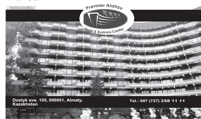
Dostyk ave. 105, 050051, Almaty, Kazakhstan