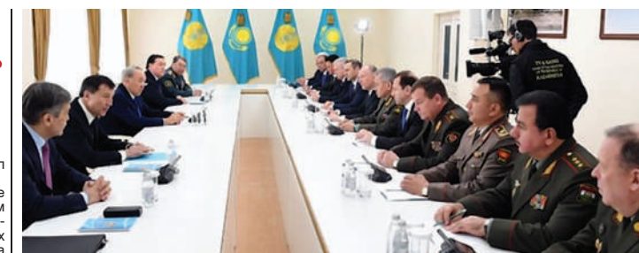
Назарбаев провел встречу с главами оборонных ведомств государств-членов ОДКБ

В завершение выступления Глава государства отметил, что реализуемые сегодня пять социальных инициатив открывают широкие возможности для малого и среднего бизнеса, а также выразил уверенность в том, что принятие данного Закона станет новым серьезным стимулом для усиления предпринимательской деятельности в стране на благо процветания всего народа.