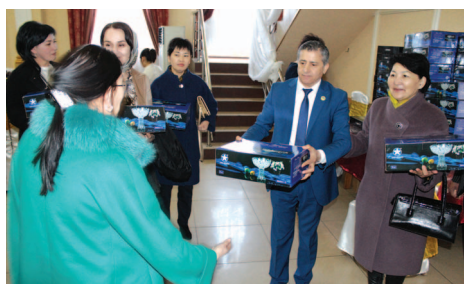
весенним праздником — 8 марта.

Курметті аналар, қарындастар! Сіздерді кектемнің алғашқы наурыз күнімен, кешегі өткен «Алғыс айту» күнімен, 8 наурыз Халықаралық әйелдер күнімен шын жүректен құттықтауға рұқсат етіңіздер!