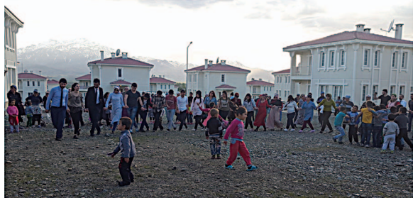
Ailelerle birlikte halay...

Erzincan, kuzeyinde Gümüşhane ile Bayburt, kuzeybatısında Giresun, batısında Sivas, doğusunda Erzurum, güneydoğusunda Bingöl, güneybatısında Elazığ ile Malatya ve güneyinde ise Tunceli'ye komşudur.