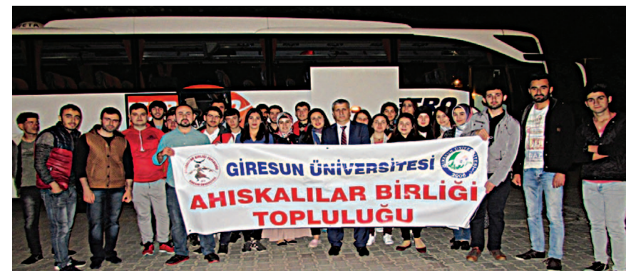
Yolculuk öncesi Güre Yerleşkesinde buluşma...

Nisan 2015 tarihinde Sayın Cumhurbaşkanımız Recep Tayyip Erdoğan'ın talimatı ile Ukrayna'nın doğusunda hükümet karşıtları arasında yaşanan çatışmalardan etkilenen Ahıska Türklerinden 677 ailenin Erzincan'a iskânî göçü kararlaştırıldı. Ve akabinde 25 Aralık 2015 tarihinde Ahıska Türklerinden 150 aile Başbakan Yardımcısı Yalçın Akdoğan'ın da "asıl memleketinize hoş geldiniz" şeklinde onurlu davranışı ve "Mehter Marşı" eşliğinde karşılamasıyla, aileler, Erzincan'ın Üzümlü ilçesine yapılan TOKİ konutlarına yerleştirildi. Devam eden süreçte 14-15 Nisan 2016 tarihinde ikinci katile 150 aile Üzümlü ilçesi ve Geyikli Mahallesi konutlarına yerleştirildi. Toplamda 301'e ulaşmış olan ailelerin sayısı ilerleyen tarihlerde (Haziran ve Ağustos) 677'ye ulaşacaktır.