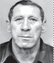
Сарыагашский филиал ТЭКЦ

Для Сарыагашского района смерть этого доброго человека стала большой потерей. В это трудно поверить.