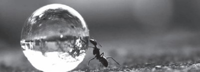
(Bakara Suresi, 153)

Şüphesiz Allah sabredenlerle beraberdir.