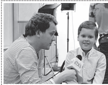
Газета «Ахыска» приглашает эрудированных и талантливых детей и школьников принять участие в интервью для рубрики «Устами детей».

Если вы хотите, чтобы ваш ребенок принял участие в интервью газете «Ахыска», вам необходимо подать заявку на участие.