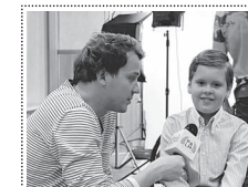
Газета «Ахыска» приглашает эрудированных и талантливых детей и школьников принять участие в интерью для рубрики «Устами детей».

Если вы хотите, чтобы ваш ребенок принял участие в интервью газете «Ахыска», вам необходимо подать заявку на участие.