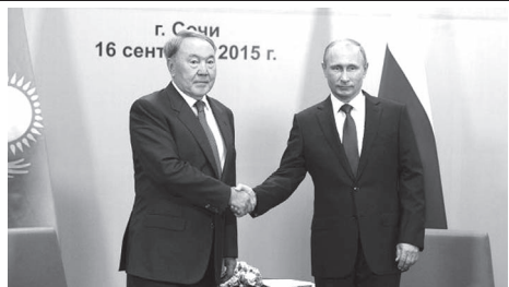
Н. Назарбаев провел встречу с Путиным в Сочи

Перед началом сессии XII Форума межрегионального сотрудничества Казахстана и России Нурсултан Назарбаев и Владимир Путин обсудили ряд вопросов сотрудничества двух стран, сообщает Kazpravda.kz со ссылкой на akorda.kz.