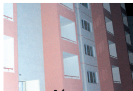
Дома, в которых расположены квартиры ТОКИ, предназначенные для турок-ахыска

Каждый мой приезд в Турцию может вылиться в отдельный рассказ об этой удивительной стране и ее обитателях.