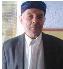
«Я хорошо помню родное село»