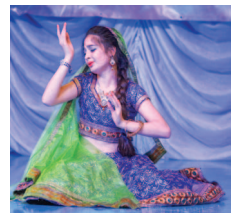
Фольклор народа — наша мудрость.