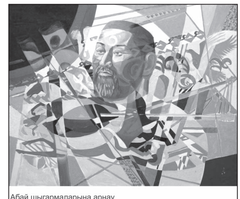
Абай шығармаларына арнау