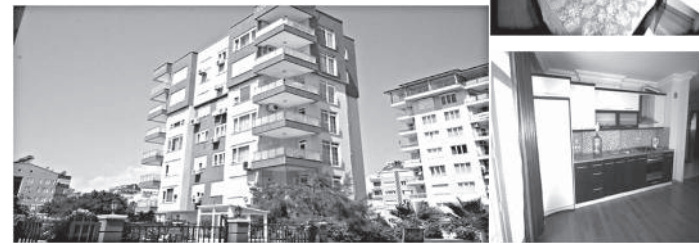
(код — реф #2380).

Выставлена на продажу квартира в новом готовом комплексе в районе Лиман, Анталия, всего в 500 метрах от моря и чистейших пляжей Коньяалты.