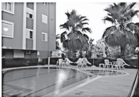
(код — реф #2431).

Если Вы предпочитаете жить красиво и комфортно, то эта квартира именно для Вас. Жилой комплекс в самом сердце Лары напротив отеля Дедеман с прекрасным видом на Средиземное море, горы Таурис и пляжи Коньяалты.