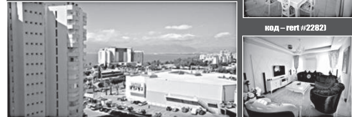
код — реф #2282)

В 2 минутах ходьбы рестораны, Стелла Манзара, Биг Мен, Тапас, кафе Дон Кишот, Шекспир, Мак дональдс, аквапарк, парки с фонтанами, торговые центры, продуктовые магазины, кофейня Старбакс, школы, больницы, транспортное сообщение.