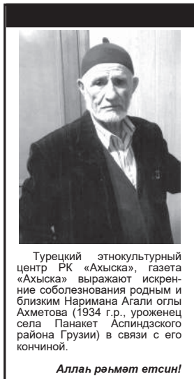
Алла рәһмәт етсин!