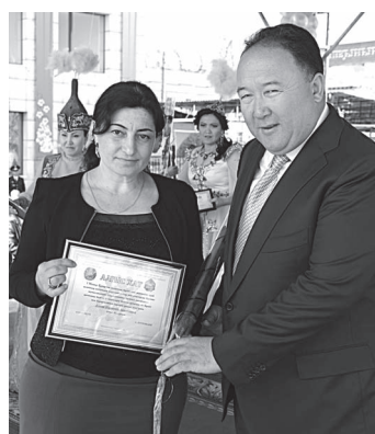
«Сила птицы — в крыльях, а человека — в дружбе»

Дружба, труд, мир... На всем земном шаре, на всех языках звучат эти заветные слова. Мир — чтобы трудиться, радоваться влюбленным вёсам, мечтать. Свободный труд — чтобы украшать родную планету, приносить людям радость и счастье. Народ Казахстана делает всё для того, чтобы с каждым днём крепнул мир на земле. Одним из самых ярких праздников всегда является празднование Дня единства народа Казахстана. 1 Мая — олицетворение любви и преданности гражданскому долгу. В этот день централь-