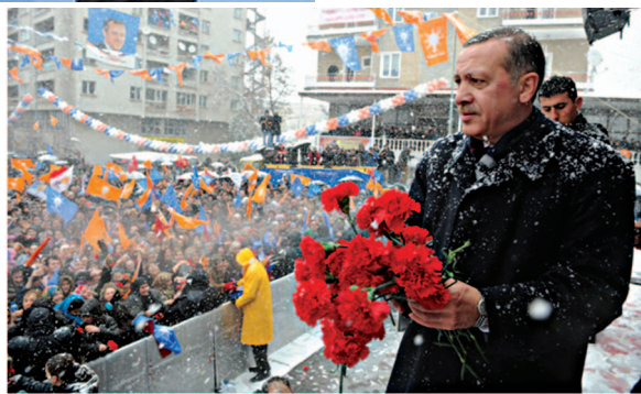
mazlığından dolayı, her zaman zaferlere yol açabilecek bir serkerde...

Yüce Allahımız bizlere 100-200 yıldan bir verdiği bir adam bahsetmiş: Recep Tayyip Erdoğan. O bir serkerde... Vatann mağlup ol-