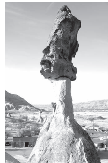
Sevil Allahverdi kızı PİRİYEVA