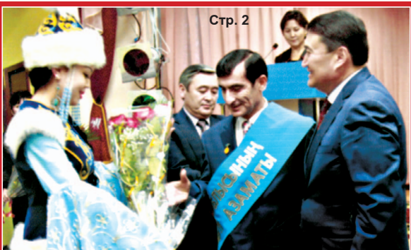
Поздравляем акима Алматинской области Ансара Турсынхановича Мухаханова с вручением ему высшей государственной награды — ордена «Курмет», заместителя президента правления Турецкого этнокультурного центра Республики Казахстан Шахисмаилу Ахметовича Асиева с присвоением ему звания почетного гражданина Алматинской области! Люди, вносящие вклад в развитие и процветание Алматинской области, в укрепление дружбы и согласия между этносами нашей многонациональной страны, были отмечены званиями и наградами на очередной сессии Ассамблеи народа Казахстана Алматинской области.