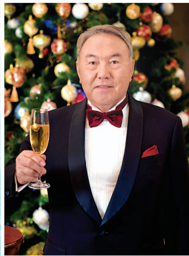
Новогоднее поздравление Президента Республики Казахстан Нурсултана Назарбаева

Kazakistan Ahıska Türkleri Milli Merkezi'nin Uluslararası gazetesi