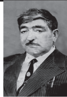
Аллаһ раһмәт етсин!