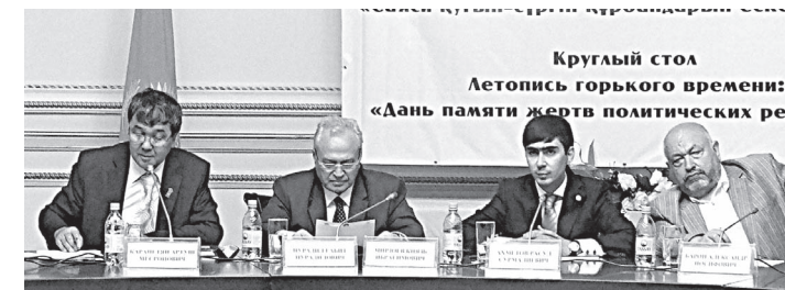
Круглый стол Летопись горького времени: «Дань памяти жертв политических репресий»